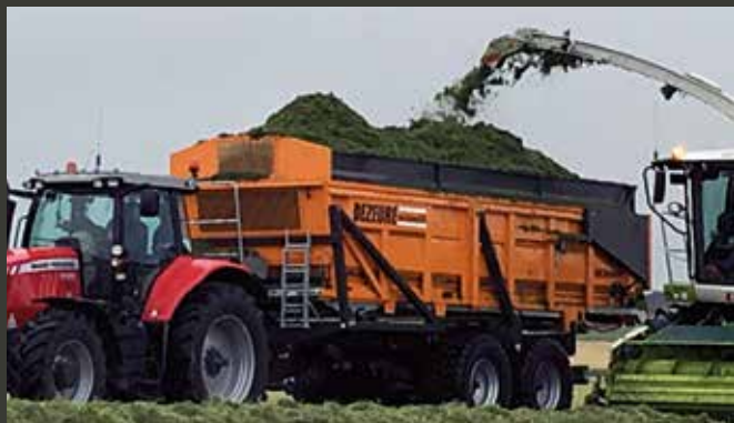
Hooglosser als silagewagen La benne élévatrice comme une benne d'ensilage