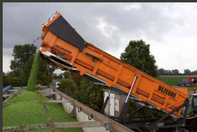
Erwtdichte uitvoering Modèle spéciale pour les petits pois