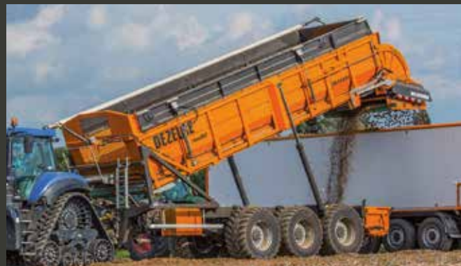
TURBOCLEANER: haalt nutteloze aarde uit je lading TURBOCLEANER: sépare la terre inutile de votre charge