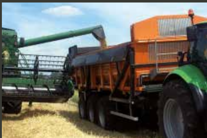
Graandichte uitvoering Modèle étanche pour le blé