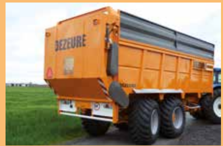
Grotere stuurhoek met fusee gedwongen stuuras Tourner plus court avec essieu directionnel